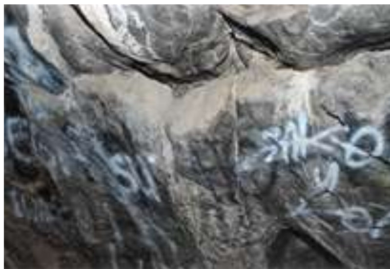
Imagen que muestra el interior de la cueva del Tabaco en la actualidad.

Desgraciadamente, hoy la cueva del tabaco es un lugar abandonado. A pesar de la importancia histórica, el sitio cuenta con escasos señalamientos y en el interior de