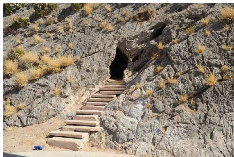
Entrada de la cueva del tabaco en la actualidad

https://www.elsiglodetorreon.com.mx/noticia/1323441.laguneros-defendieron-a-su-pais.html