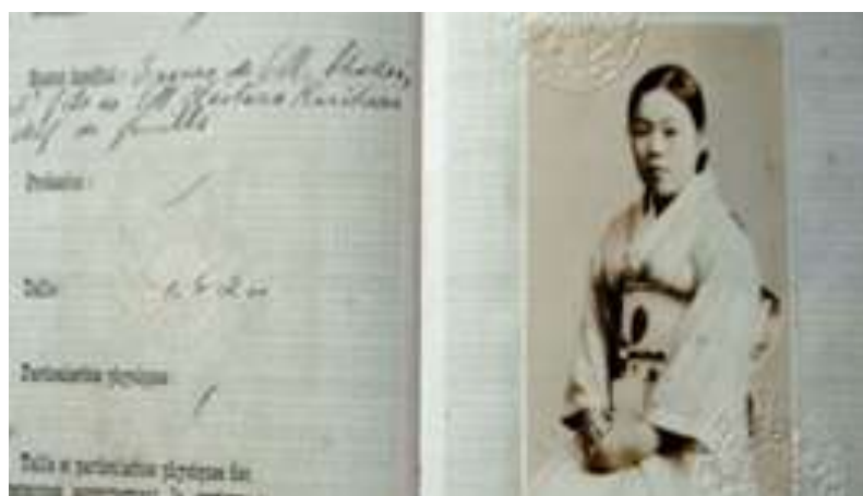
Este es el pasaporte que motivo la colección de Popol.

gobierno emitió en 1974 para el faraón Ramsés II que murió hace más de 3000 años, pero como su cuerpo momificado necesitaba salir del país a recibir tratamiento para unas reparaciones, se expidió un documento de identidad en el que se anotó como ocupación del faraón "Rey fallecido".