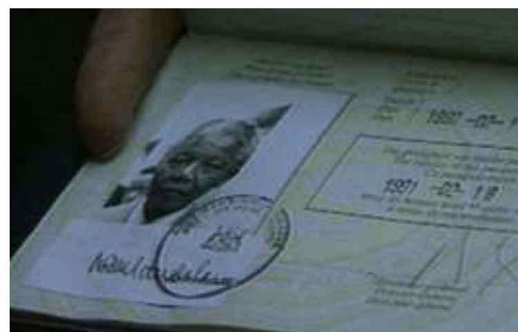
Los pasaportes de personalidades como Nelson Mandela o los Kennedy son especialmente valiosos.